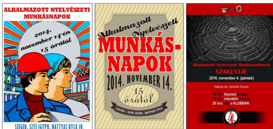
Szakesti plakátok (tervezte: Fodor Katalin)

Minden tanév első szemeszterében az újonnan belépő hallgatókat tanszéki szakest keretében köszöntik és avatják a felsőbb éves hallgatók és a tanszék munkatársai. A szakestet megelőzően a tanszéki oktatók és a meghívott előadók tematikus konferenciát tartanak a hallgatóknak a hozzájuk közel álló, de a tananyaghoz szorosan nem kötődő témákról.