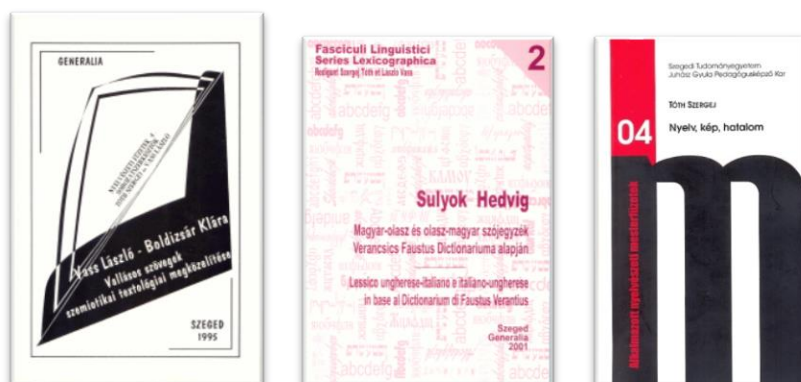
Nyelvészeti kiadványok: Nyelvészeti Füzetek (1–14. kötet), Nyelvészeti Füzetek szótársorozata (1–3. kötet), Alkalmazott Nyelvészeti Mesterfüzetek (1–9. kötet), kiadó: Generalia, valamint a Szegedi Egyetemi Kiadó, Juhász Gyula Felsőoktatási Kiadó