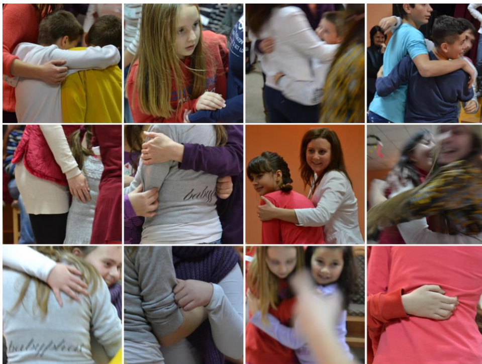
A szíváci tehetség gondozó program örömteli jelenetei (Szerbia).