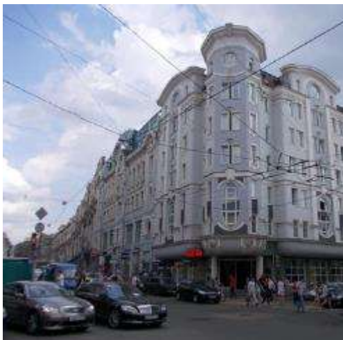
13. sz. fotó

Álszeccsiós stílusú épület a Mjaszniczkaja 16. alatt, ahol korábban a Szokolov-féle bérház állt.