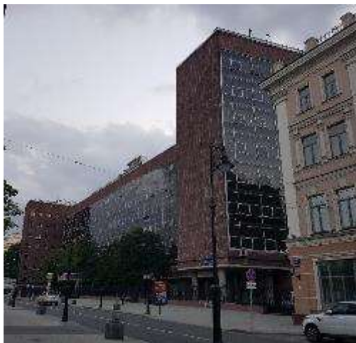
23. számú fotó Le Corbusier tervezte irodaház.