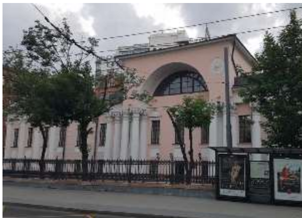
25. számú fotó