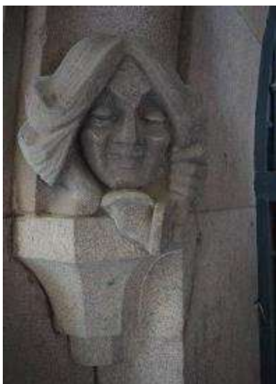
17. sz. fotó