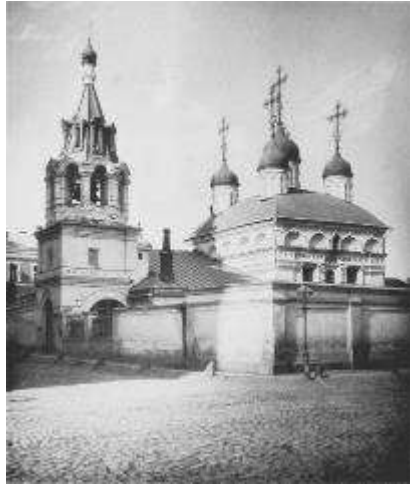
5. sz. fotó

Szent Florus és Laurus vértanúknak szentelt templomról.