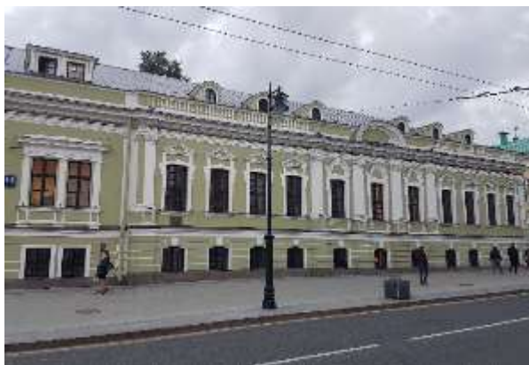
26. számú fotó