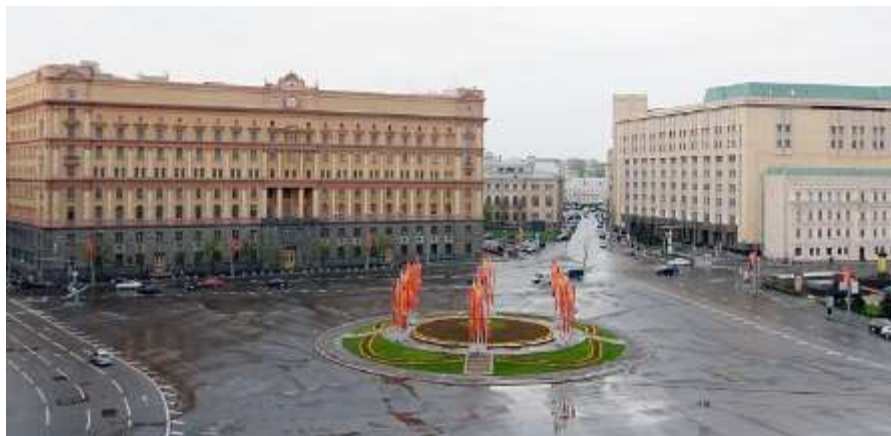
7. sz. fotó

Balról az Orosz Biztonsági Szolgálat (FSZB) átépített és megtoldott épülete. Magasságát két emelettel növelték meg. A hátsó feléhez konstruktivista épületszárnyat toldottak. Jobbról a biztonsági szolgálat számítóközpontja.