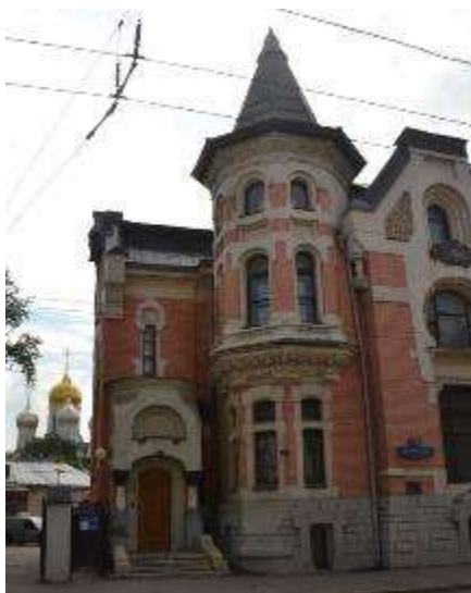
10. sz. fotó Kekusev háza az Osztujsenkán (21. sz.).