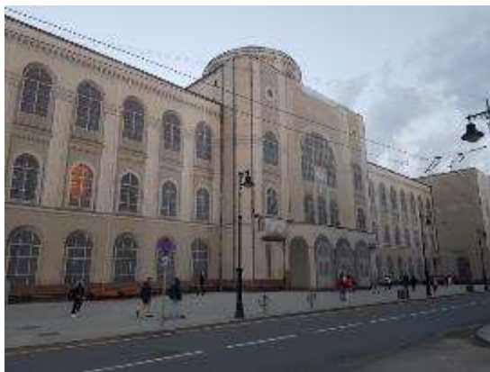
15. sz. fotó

megelevenítő hűséggel jelzi és ábrázolja a mögötte lévő, rekonstrukció alatt álló épületet (vö. a 15. sz. fotóval). Nem ez az egyetlen postája az utcának.