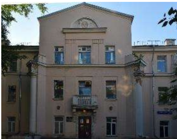
4. sz. fotó

A lengyel Szent-Péter-Pál-templom 1940 körül.