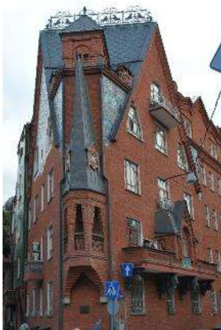
11. sz. fotó Percov háza. Kurszovoj köz (1. sz.).