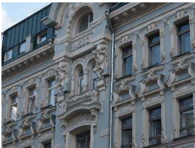
14. sz. fotó

Álszeccsiós stílusú épület a Mjaszniczkaja 16. alatt, ahol korábban a Szokolov-féle bérház állt.