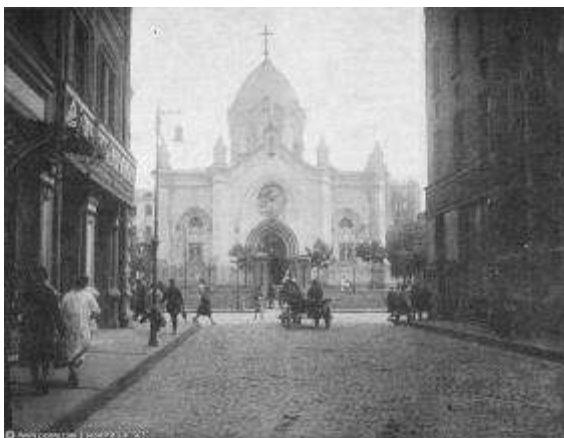
3. sz. fotó

Így lett az utca templomtalanná, ami még a sztálini és hrucsovi templomrombolást tekintve is szokatlan jelenség Moszkvában. Azaz mégsem. Maradt templom „épület-ügyileg”, de csak a jó szemű szemiotikus számára (lásd a 3. és 4. sz. fotókat).