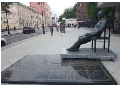
24. számú fotó Le Corbusier szobra az általa tervezett épület előtt.

A sztálini nagy városátalakítási időszak természetesen nemcsak rombolás, de az akkori építészeti divatok szerinti csodálatos új mérnöki építészeti csodák születésének az időszaka is. Ilyen az 1930–36 között Charles-Edouard, sokak szerint Jeanneret, vagy ahogy a világ jobban ismerte, Le Corbusier tervezte irodaépület (vö. a 23. sz. fotóval). Szín- és formavilága talán idegenül hatott Moszkvában, de avangard megoldásaival a korszak legjobb, belső tereivel a leghumánusabb, legkomfortosabb épülete lett a városnak. Előtte állították fel Le Corbusier szobrát (lásd a 24. sz. fotót).