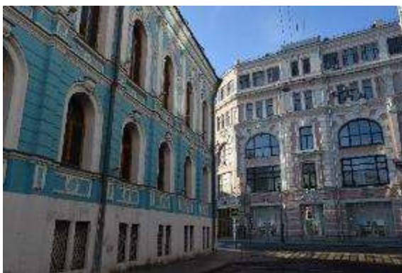
9. sz. fotó

Balról a palota valamikori könyvtárszárnya. Jobb oldalon az ún. Porcelán Háza.