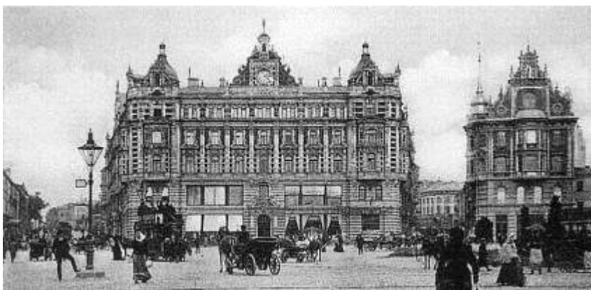
6. sz. fotó

A Mjasznyickaja utca számozása a Kitaj-gorod, a Ljubljanka tér felől kezdődik (a legtöbb ház számozását lásd a cikk végén). Az utca torkolatánál álló, bejáratukkal a tér felé néző épületek a hosszú évtizedek alatt – s napjainkban is – a szovjet, majd orosz biztonsági szervek központja(i)nak adnak helyet. Ezek a forradalom előtt az orosz főváros urbanisztikai szempontból egyik kiválóan megtervezett és átgondoltan megalkotott terén álltak. A forradalom előtt a tér lezárásaként az „Oroszország” nevű biztosítótársaság székháza uralta a látványt. A 20-as években az akkor divatos konstruktivizmus jegyében az épülethez még csak hozzáépítettek néhány szárnyat, de a 70-es években – már a brezsnyevi időkben – a felismerhetetlenségig átalakították (vö. 6. és 7. sz. fotókat). Már csak a homlokzati óra, illetve a jobb oldalon álló épület meghagyott homlokzata emlékeztet a régire. A módszer egyébként nem orosz, bőven van rá példa Ottawától Manhattanig (vö. Hearst Tower, New York és Ottawa ON-Bank of Canada), az ún. brüsszelizációról (Bruxellisation) nem is beszélve.