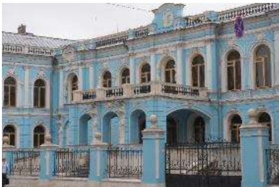
8. sz. fotó