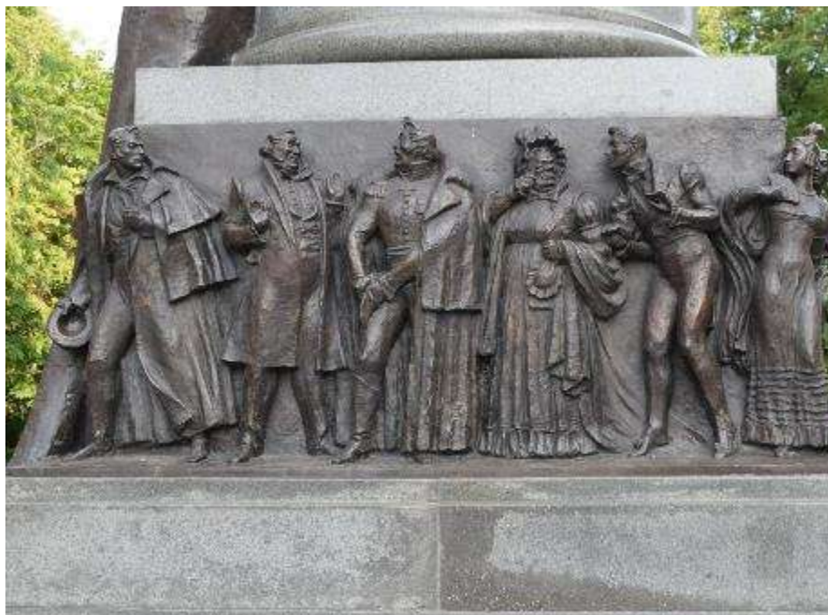
22. számú fotó

A Mjasznyickaja utca 42. sz. alatti házat a 19. század elején építette Ivan Ivanovics Barisnyikov, nyugalmazott őrnagy, egyben gazdag föld- és gyártulajdonos. A klasszicista stílusban épült palotát megkímélte az 1812-es tűzvész, de a francia katonák zabralását nem úszta meg. A megszállók mindent, amit el is lehetett vinni, el is vittek, csak a ház belső díszítése maradt meg (lásd a 21. számú fotót).