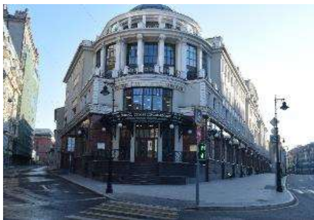
2. sz. fotó

A szent Euplus (Eupliusz) tiszteletére épült templom.