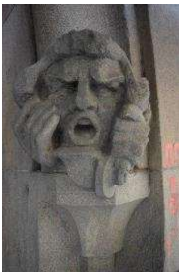
18. sz. fotó