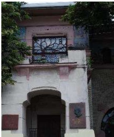
12. sz. fotó

Rjabusinszkij villa. Malaja Nyikitszkaja (6/2. sz.).