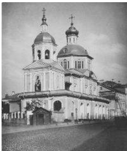
1. sz. fotó

Москвы) folyóiratban olvashatjuk azt, hogy a Gépipari Gyári Állami Egyesület Központi Igazgatósága kezdeményezésére ezen a helyen épül fel a kilencemeletes Trösztök Palotája. Természetesen, ahogy sok más is, ez sem épült meg, viszont sokévnnyi huzavona után, már a rendszerváltás utáni időben emeltek itt egy historizáló épületet, nem lényeges, hogy milyen oktatási intézmény számára (vö. a 2. sz. fotóval).