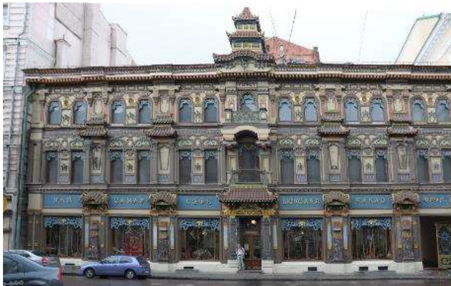
19. sz. fotó